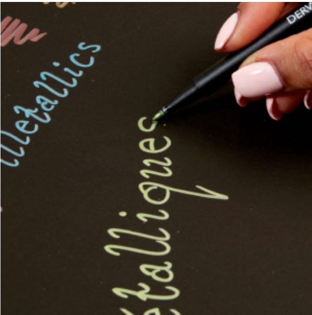
☐ Potrivit pentru hartie neagra