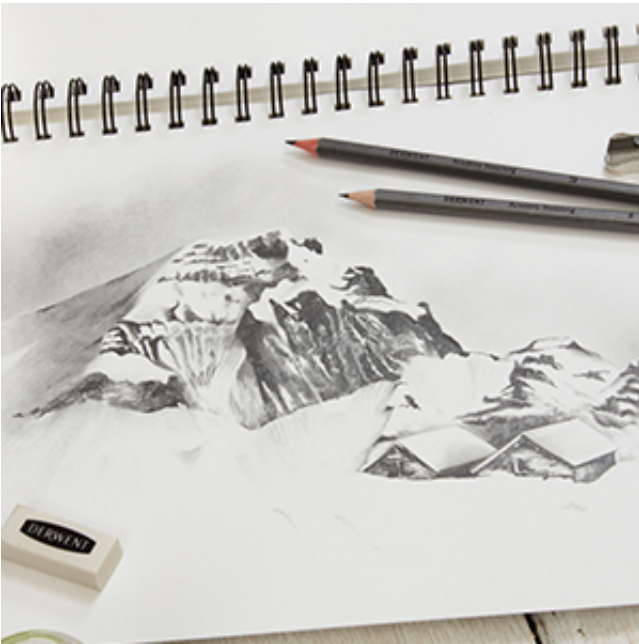
?? Profunzimea desenului