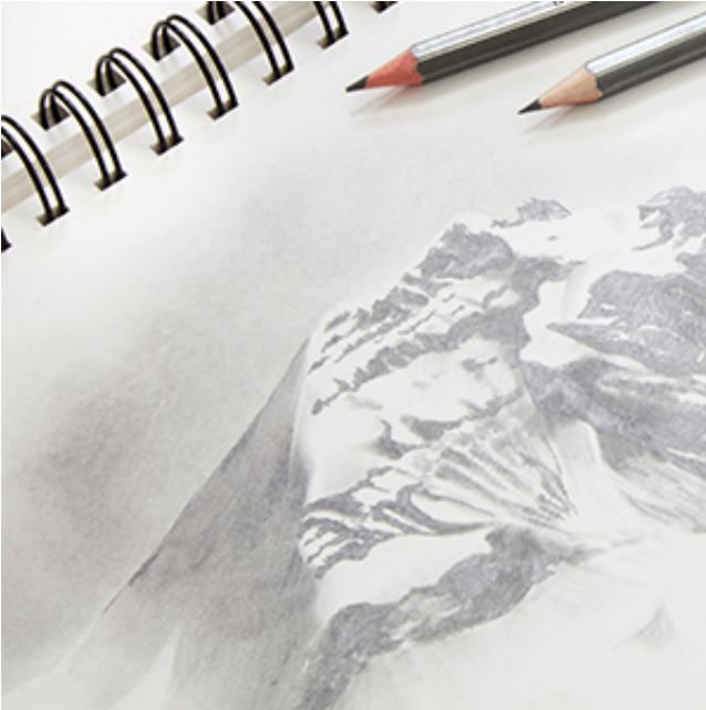
?? Textura si umbre