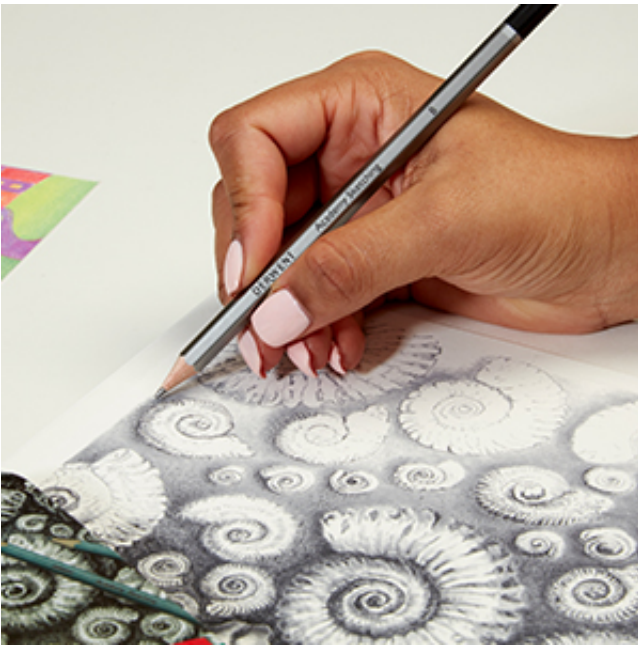
?? Forma hexagonala asigura o prindere optima