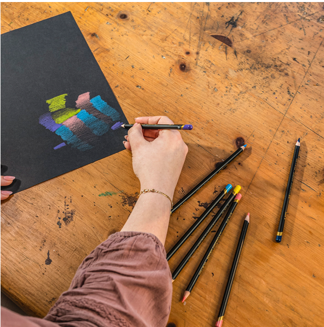
Textura neteda faciliteaza umbrirea si amestecarea culorilor