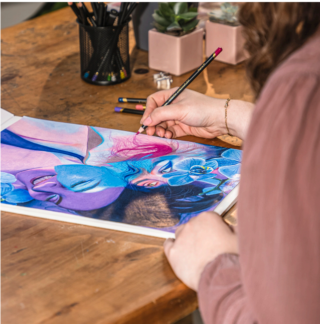
Foarte pigmentat pentru lucrari izbitoare, care iese chiar in evidenta pe hartie neagra