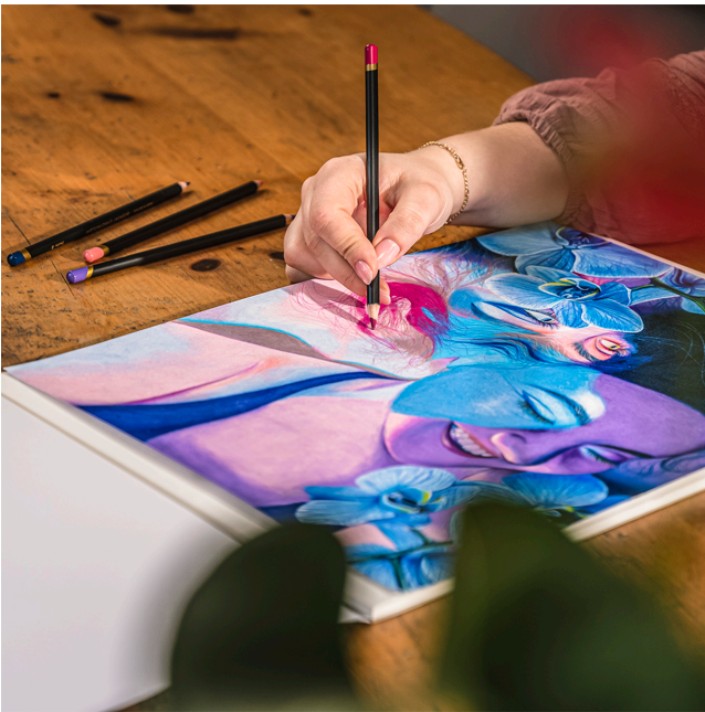
Moștenire din anul 1832