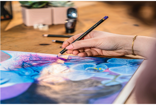
Miezul moale rezista la rupere si poate rezista la presiune in timpul utilizarii